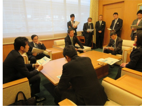
【社長の現場巡視】 平成 30 年 11 月 13 日