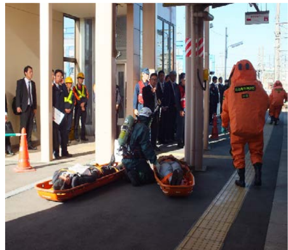
【第二種鉄道事業者が実施する鉄道テロ訓練に参加】 平成 30 年 12 月 5 日